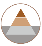
AUS DEM SELTZAL